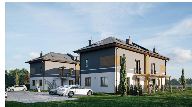
LOKALIZACJA INWESTYCJI / ul. Dębowa /Radzymin